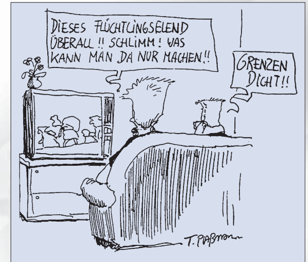
Migration in der Karikatur vom 30.11. - 22.12.2008